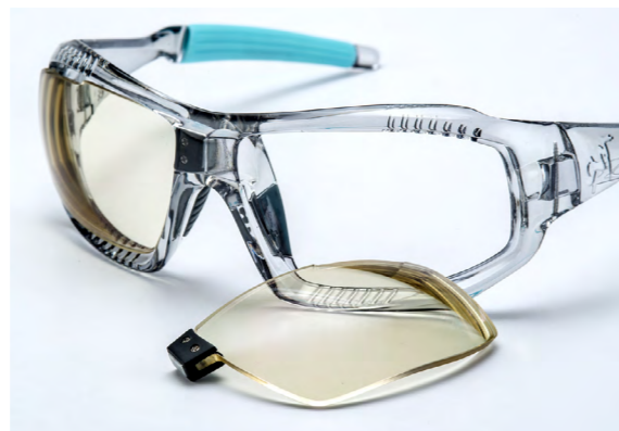
圖 2. 矯正型運動太陽眼鏡